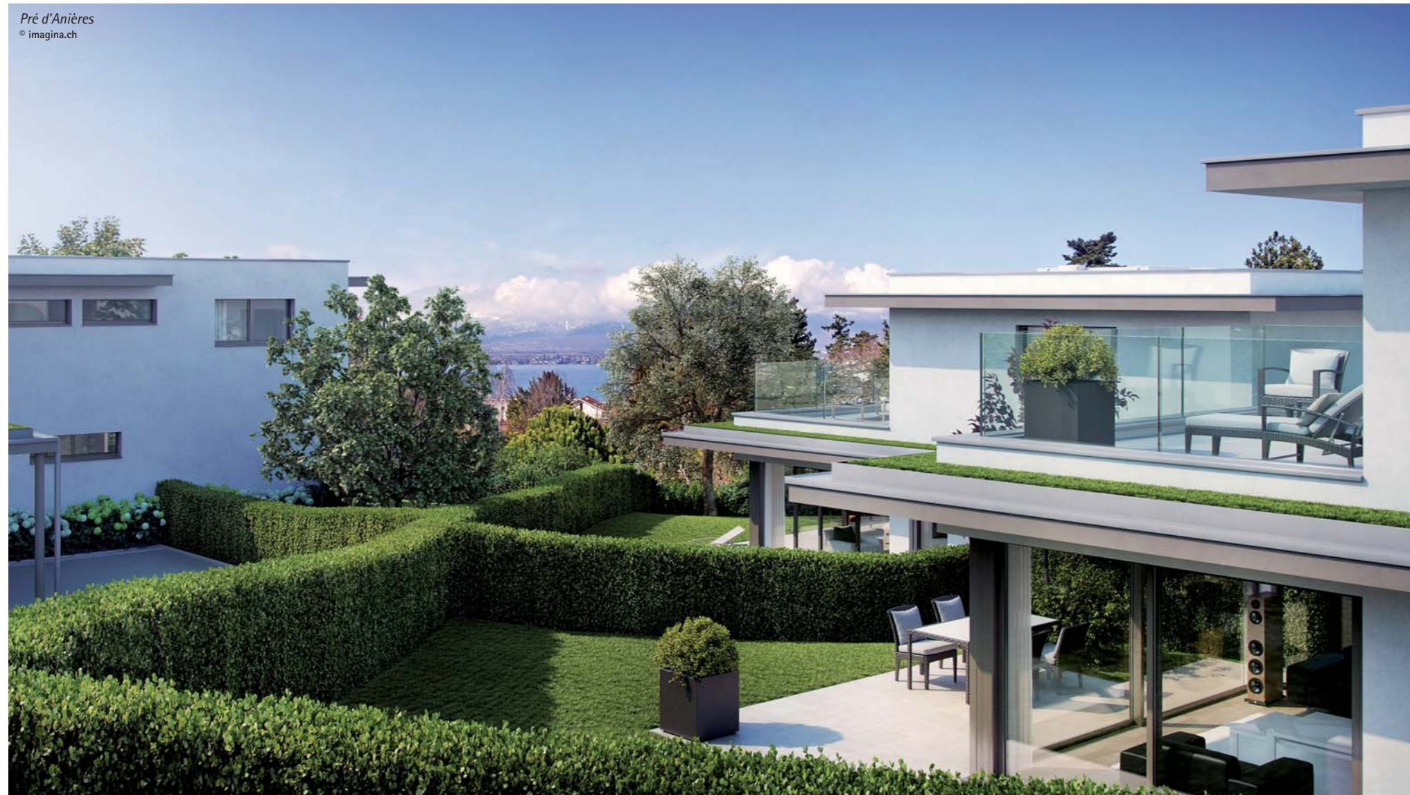
Pré d'Anières